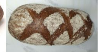
Buchweizen-Dinkel 500g Dunkles Kornbrot mit Buchweizen, Roggen-, Dinkelmehl