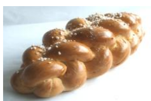
Hefezopf 500g, 250g