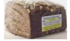
Dinkelschnittbrot Dinkel-Vollkornbrot ohne Weizen, geschnitten, mit Natur- sauer, Buttermilch, Sonnen- blumenkerne