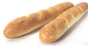
Baguette 250g, 500g Weizenbrotstange