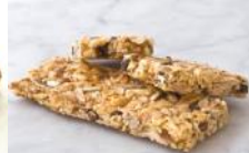
Müsliriegel Power-Riegel mit Hafer, Sesam, Sultaninen, Mandeln, Honig, Sonnenblumenkerne