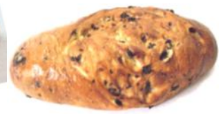
Weinbeerwecken Weizengebäck mit Weinbeeren