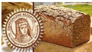
Hildegardbrot 500g Dinkelbrot nach Hildegard v. Bingen mit Naturjoghurt, Hafer, Sesam