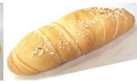
Salzstange Weizengebäck mit Salz