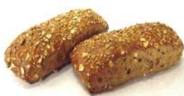
Joghurtriegel Rustikales Korngebäck mit Naturjoghurt, Hafer, Sesam, Sonnenblumenkerne