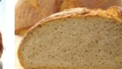
Kartoffelbrot 500g Mischbrot mit geriebenen Kartoffelstückchen