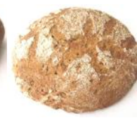
Bauernlaib 500g Roggenmischbrote mit Natur-Sauerteig, Kümmel, Koriander, Fenchel