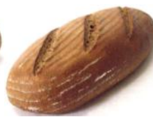
Roggi 500g 100% Roggenbrot, mit Natur-Sauerteig