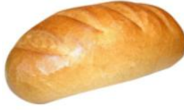
Weißbrot 250g, 500g Weizenbrotwecken