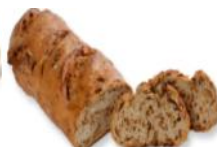
Speckweckerl Weizen/Roggenweckerl mit Kümmel, Sauerteig, Tiroler Speckwürfel