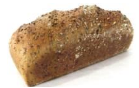
Nikolauser 500g Sesam, Leinsaat, Sojaschrot, Sonnenblumenkerne, Haferflocken, Roggen-, Weizenschrot