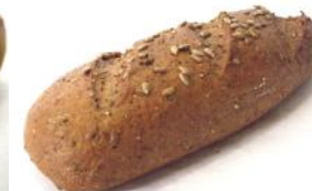
Sonnenblumenbrot 500g Leichtes Kornbrot mit Sonnenblumenkerne