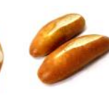
Mini-Laugen Mini-Gebäck ohne Dekor-Salz