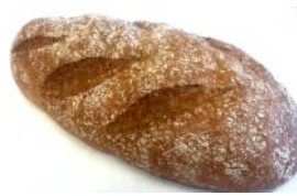
Keimlingbrot 500g Rustikales Keimlingsbrot mit Malz