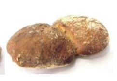
Südtiroler Paarl 230g Roggenmischgebäck, mit Natur-Sauerteig, Fenchel, Kümmel, Brotklee