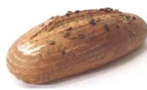
Kürbiskernbrot 500g Kornbrot mit Sesam, steirischen Kürbiskernen