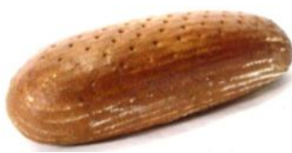
Schwarzbrot 500g, 1kg Mischbrot aus Roggen und Weizen, mit Natur-Sauerteig und Brotgewürz