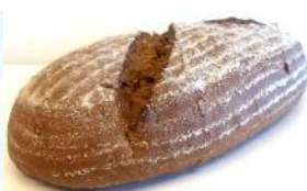
Vesulbrot 500g Mit den alten Getreidearten: Emmer, Einkorn, Kamut