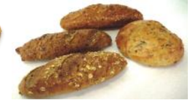
Kornspitz, gemischt Diverse Kornbrötchen gemischt