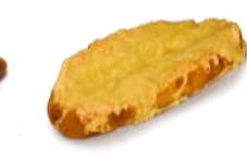
Käse-Laugen Laugenstange mit Gouda überbacken