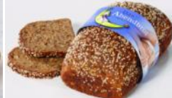
Abendbrot 500g Viel Eiweiß, wenig Kohlenhydrate