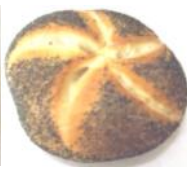
Mohnsemmel Weizengebäck mit Blaumohn