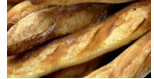
Topfenbaguette 250g Weizenbrotstange mit Tiroler Topfen