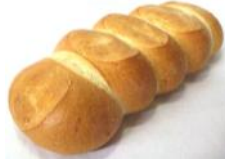
Zeile 250g Weizenbrotstengel Steilig