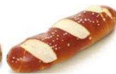
Laugenstange Weizengebäck belaut, Dekor-Salz, auf Wunsch ohne Salz