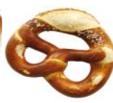
Laugenbreze mit Salz bestreut