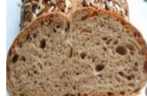
Krustenbrot 500g Kornbrot mit Hafer, Sesam, Kürbiskerne, Sonnenblumenkerne