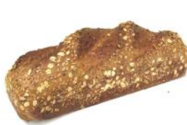
Joghurtbrot 500g Helles Kornbrot mit Natur- Joghurt, Sonnenblumenkerne, Sesam, Hafer