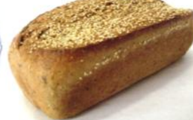
Sechskorn 750g Helles Kornbrot mit sechs verschiedenen Körnern