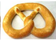
Breze weiß Weißbrotbreze