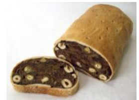
Zelten 1kg, 500g

Gluten- und Lactosefreies Zöliakie-Brot mit Sesam, Soja, Sonnenblumenkerne