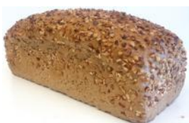
Nussbrot 500g Roggenschrot, Weizenschrot, Walnüsse, Gewürz