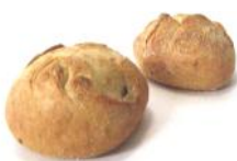
Wachauer 100g Weizen/Roggenlaibchen mit Kümmel, Sauerteig