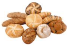
Jourgebäck 25g Kleingebäckmischung