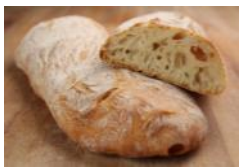
Ciabatta 250g Ital. Weizenbrot mit Bio-Olivenöl