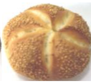
Sesamsemmel Weizengebäck mit Sesam